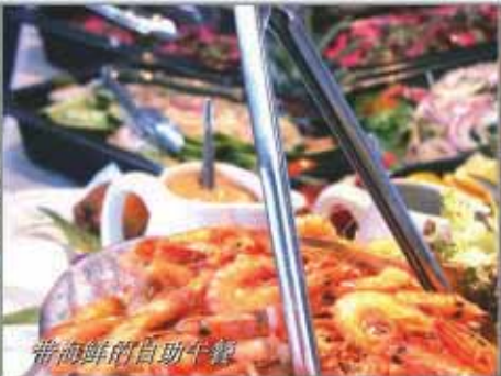
带海鲜的自助午餐