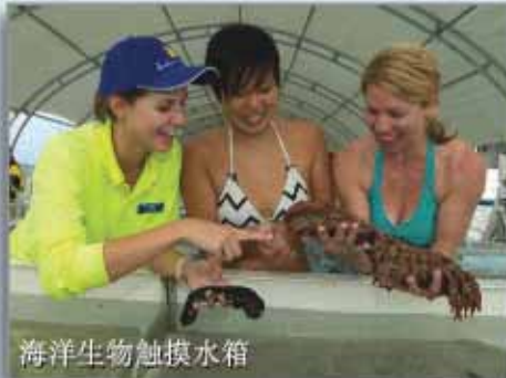
海洋生物触摸水箱