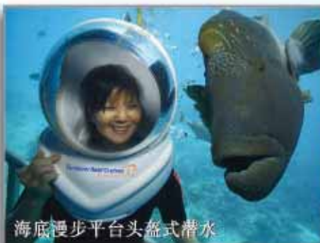
海底漫步平台头盔式潜水