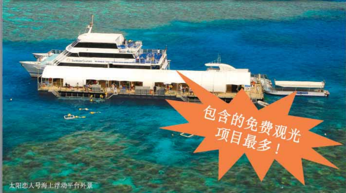
太阳恋人号海上浮动平台外景