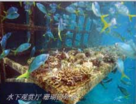
水下观赏厅 珊瑚礁外景